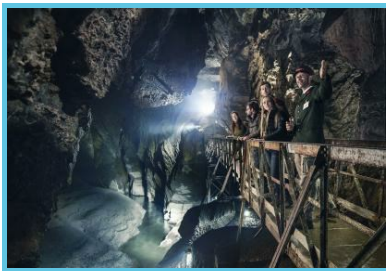
Domaine des Grottes de Han