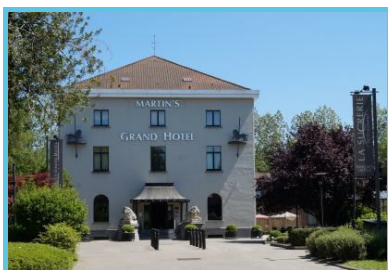
Martin's Grand Hotel

Chaussée De Tervuren 198 Waterloo - 1410