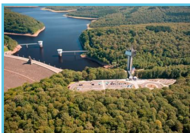
Barrage du lac de la Gileppe